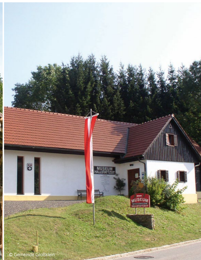
Hallstattzeitliches Gehöft am Burgstallkogel